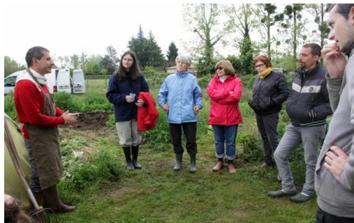
Pour certaines, c'est la première présentation du concept de la permaculture.