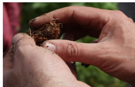
C'est la terre d'une butte faite l'année dernière, les bouts de bois ne se sont pas décomposés...

Nous remercions les organisateurs de nous transmettre ces connaissances ainsi que les participants pour cette bonne ambiance .