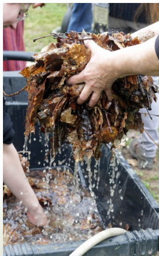
Les feuilles sont trempées avant de les mettre sur la butte.

Entre midi et deux nous avons mangé à l'association, dans une ambiance conviviale et chaleureuse, qui nous a donné des forces pour continuer la réalisation de la deuxième butte chez Éric.