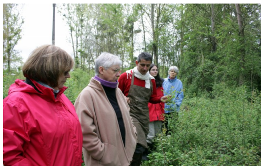
À la recherche du bois sacré. On observe les processus naturels dans le bois jeune.