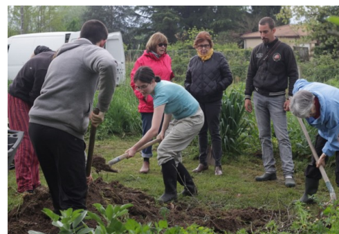
Au travail collectif !

En étudiant les sols, il s'aperçoit qu'ils donnent la vie grâce à sa complexité, sa micro biologie et sa diversité. Il constate aussi que l'agriculture moderne intensive, à base d'engrais chimiques et de pesticides, ne respecte pas l'humus de nos sols. Elle utilise des énergies fossiles et donne au final une agriculture peu rentable.